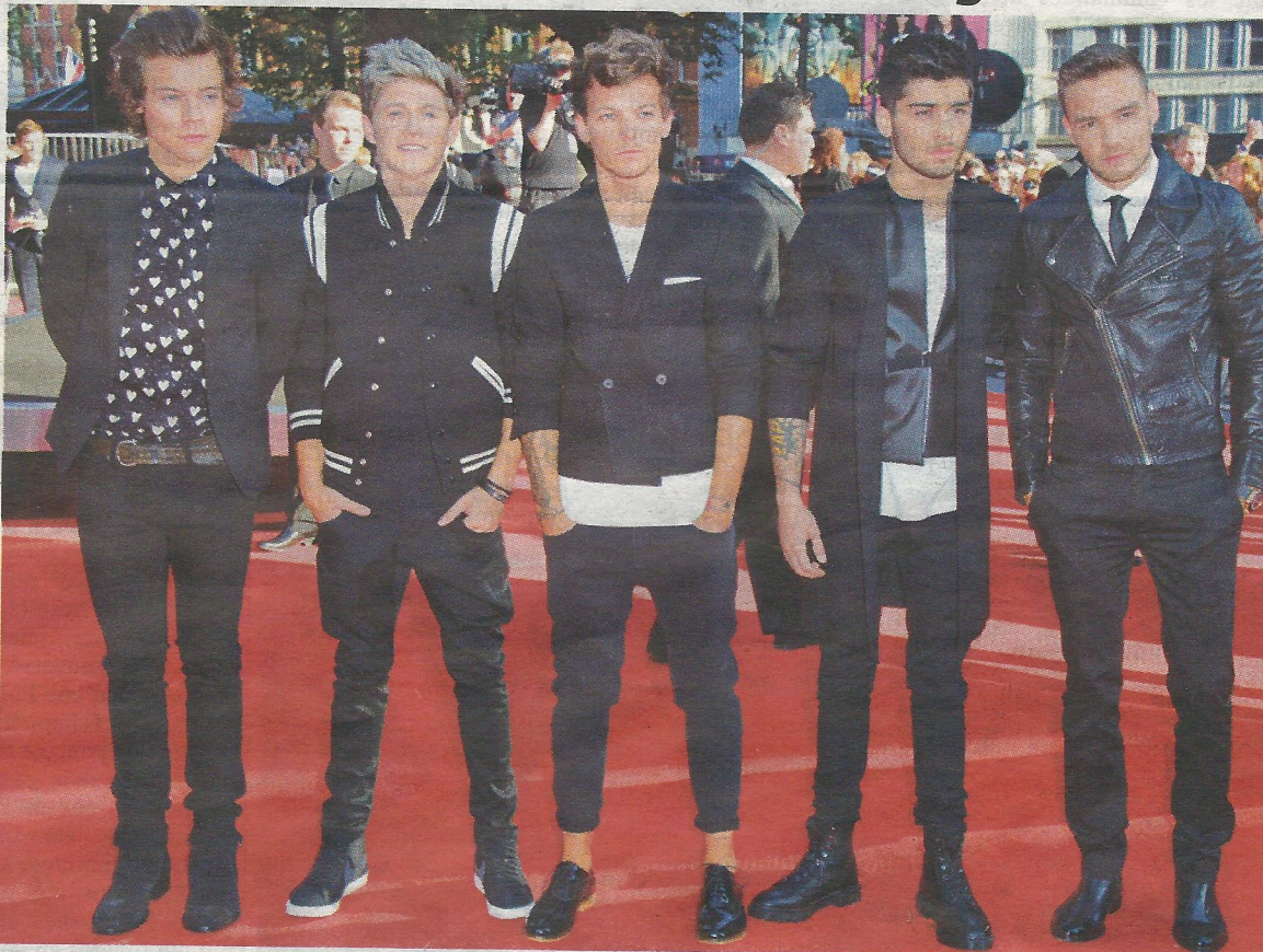
Harry Styles, Niall Horan, Louis Tomlinson, Zayn Malik et Liam Payne (de g. à d.) formaient les One Direction, créés en 2010.

Zayn Malik (22 ans) ne fait plus partie de One Direction. Le groupe phénomène britannique va poursuivre sa tournée mondiale en cours sans lui.