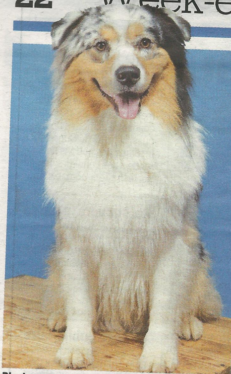
Plusieurs milliers de chiens seront à Luxexpo.