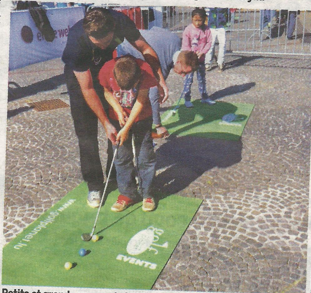
Petits et grands pourront s'initier au golf avec des professionnels.