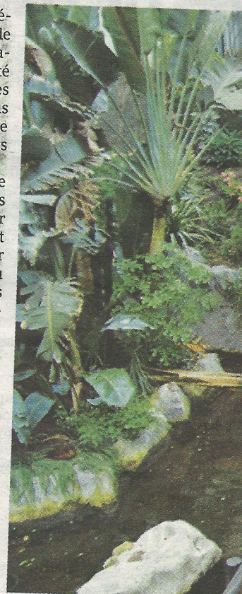
Le Parc merveilleux a battu des pics